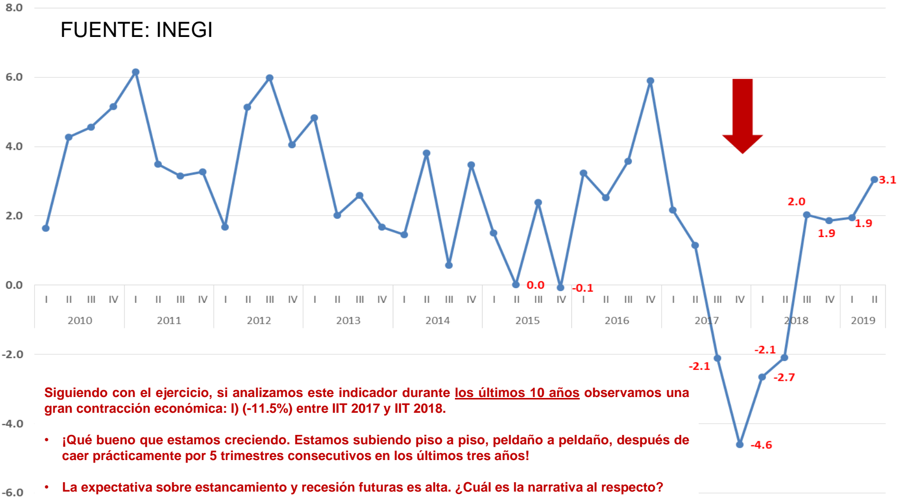
Durango Indicador Trimestral de la Actividad Económica Estatal (INEGI) IT 2010 - II 2019 Variación porcentual anual trimestral